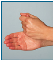
Daumen mit der anderen Hand umfassen und drehend desinfizieren