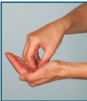
Fingerspitzen in der hohlen Hand kreisen

Beachten Sie dabei bitte folgende Schritte: